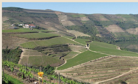
6. Alto Douro